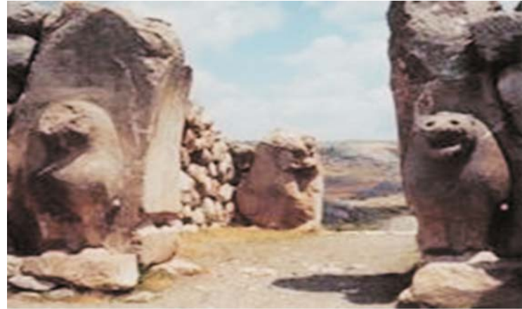
Ruinas de Hattusa en Bogazkoy

kaska fueron incorporados al imperio, que incluía, buena parte de Chipre y diversos territorios en Siria, donde el reino hitita limitaba al este con Asiria y al sur con Egipto.