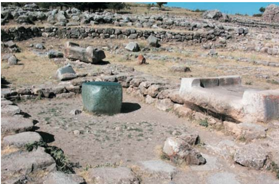
Ruinas Hattusa, piedra ceremonial (altar)