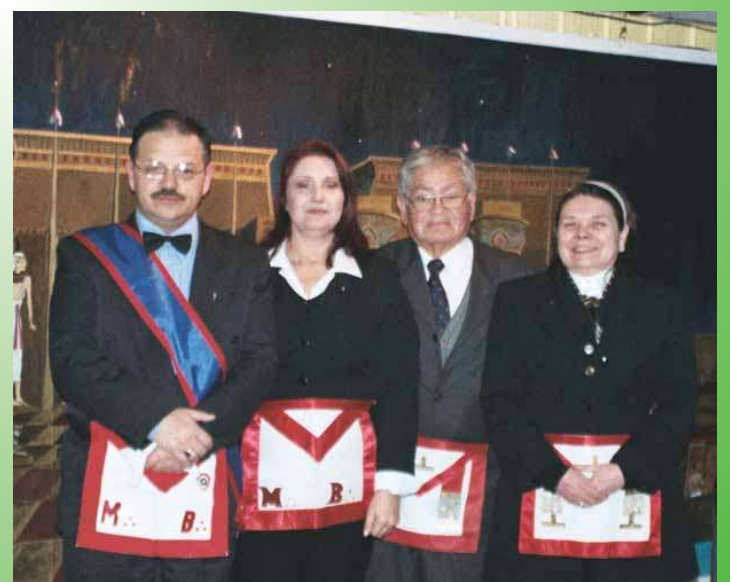
Algunos M.M. que acompañaron a los HH. Aprendizices en la Ceremonia.