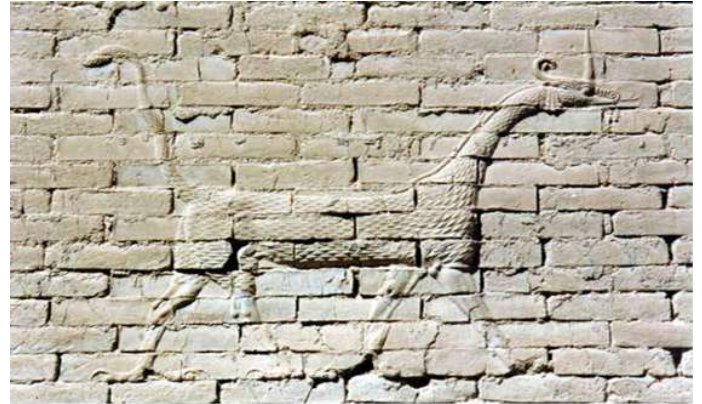
Iraq, Bagdad. Grabado babilónico

Se produce la reforma de la I dinastía babilónica, y se altera el panteón mesopotámico, Marduk, dios secundario, se transforma en deidad estatal por excelencia, lo que queda reflejado en la literatura de esa época, surge una nueva jerarquía de seres supremos, son numerosos, sería poco prolijo intentar citarlos. Existe una triada (tres dioses) en los que figuran seres