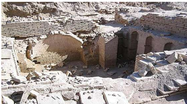
Mashu-la historia en la piedra

Samas, sentado en un trono, con el atributo del disco solar, un león con sus garras sobre un hombre símbolo del dominio, en ocasiones rayos brotan de sus hombros. Istar tenía tres características, diosa de las batallas, del amor y del planeta. Venus, tenía atributos y símbolos distintos. A Istar Guerrera la escolta un león y lleva un arco y aljaba. Istar Amor; aparece desnuda y con dos palomas. Istar Venus; con el planeta.