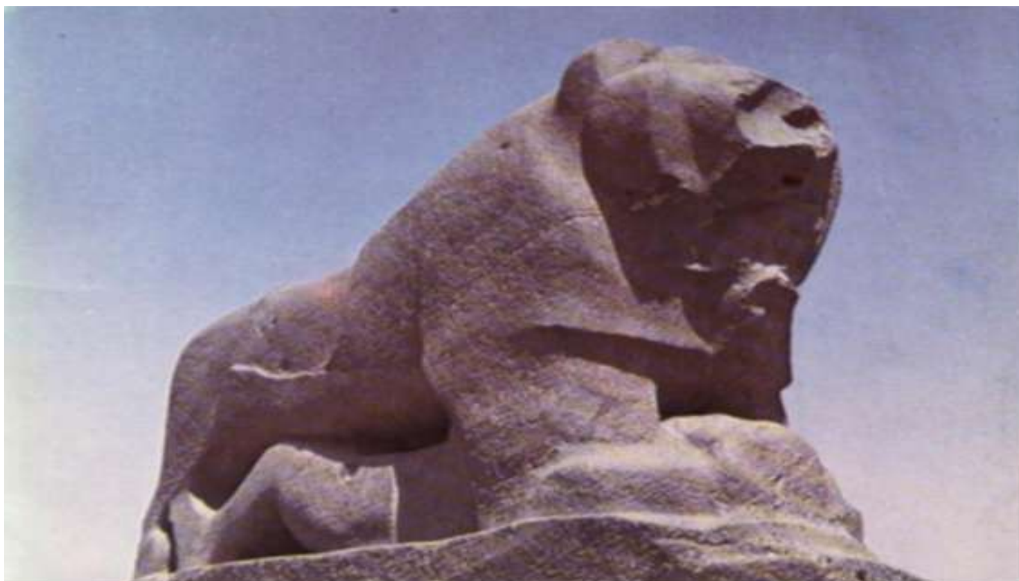
Milenario monumento a Samas

Según el relato Bíblico, Babilonia fue fundada por Nemrod en el 2500 antes de nuestra era, quien también construyó la famosa Torre de Babel. El Génesis, capítulo 10, versículo 8 nos relata: “Cus engendró también a Nemrod: éste comenzó a ser prepotente en la tierra. Era un cazador forzado delante del Señor. (De ahí vino el proverbio: Como Nemrod, forzado cazador ante el señor) Y el principio de su reino fue Babilonia, Arac, Acar y Calanne, en la tierra de Sennaar. De este país salió Assur, el que fundó a Nínive, Rejobot-Ir y Cala”. En este periodo la lengua predominante en la región era el acadio, que había sido llevado a la región en las invasiones semíticas que se produjeron en torno al 3000 antes de nuestra era. Poco a poco fue sustituyendo al idioma sumerio durante los siglos siguientes, especialmente durante las conquistas de Sargón siete siglos después.