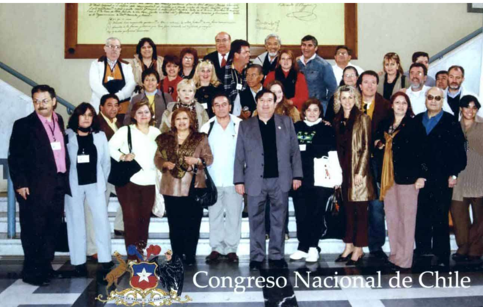
Congreso Nacional de Chile

En este número: El 4° Encuentro de CIMAS y 2° de Altos Grados, realizado en Santiago de Chile.