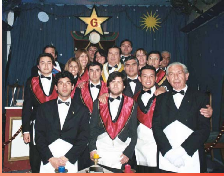
Las HHnas. y HH. AApr. asistentes rodean simbólicamente a nuestro Gran Maestro y al Delegado Regional.