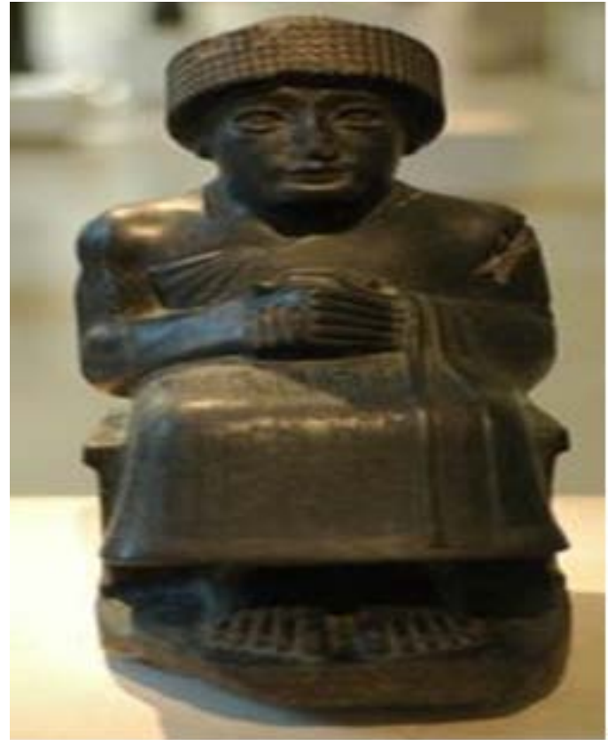
Estatuilla de Gudea de Lagash, príncipe de Lagash