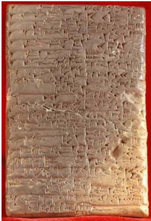
Escritura cuneiforme sumeria

"Dos desarrollos realizados durante los años 1950 permitieron una mejor comprensión de la literatura sumeria. En Chicago Landsberger estaba editando material para el Sumerian Lexicon. En Filadelfia, Samuel Noah Kramer estaba ocupado poniendo a disposición de los estudiosos tantas tablillas como fuera posible de las colecciones de Filadelfia, Istambul y Jena."