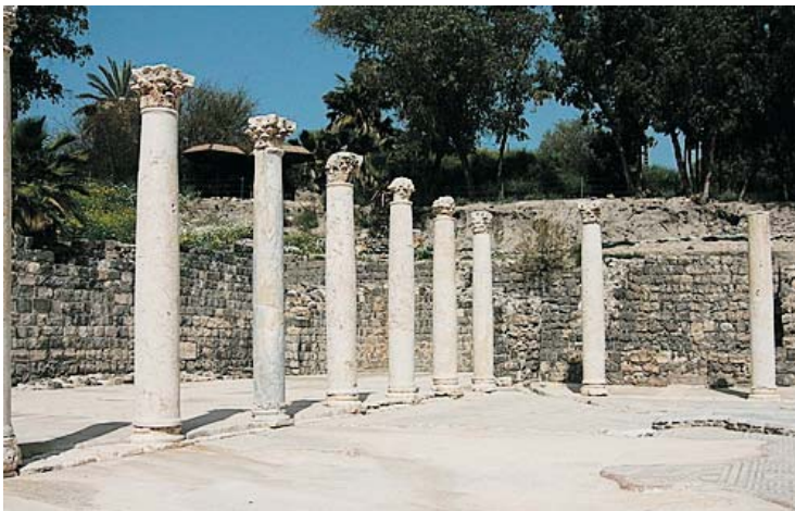
Base, Fuste y Capitel. Columnas milenarias

Los asirios comenzaron a ampliarse al oeste el siglo IX, el año 859 antes de nuestra era, habían alcanzado el mar Mediterráneo, donde ocuparon ciudades fenicias. Damasco y Babilonia quedaron bajo el dominio de los asirios. Durante el siglo VIII antes de nuestra era, el imperio asirio parecía tenue, pero Tiglath-Pileser III subió al trono y sometió a sus vecinos, capturada Siria se coronó rey de Babilonia. Desarrolló un ejército permanente bajo una administración organizada. Sennacherib construyó la capital Nínive en el río Tigris, con Babilonia destruida y Judá constituida en un estado. El año 612 antes de nuestra era, las rebeliones del pueblo se combinaron con las fuerzas de dos nuevos reinos, el de Medes y los caldeos (Neo-Babilónicos), para derrotar a Asiria. El odio que los asirios inspiraron con su política de restablecimiento, el pueblo estaba oprimido, era suficientemente grande para asegurar su decadencia. Los asirios utilizaron las artes visuales para representar muchas conquistas, los frisos continúan siendo un recuerdo de esta civilización