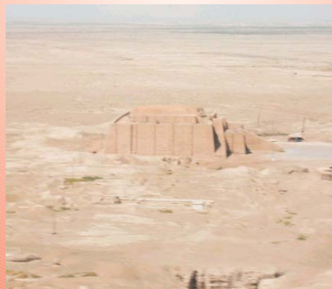
Ziggurat Ur Nammu (fotografiada a la distancia por conflictos locales)

cual separó la autoridad religiosa de la secular. Para asegurar su supremacía, Sargon formó el primer ejército reclutado, desarrolló lo relacionado con la necesidad de movilizar a una gran cantidad de trabajadores en la irrigación y de inundar áreas bajo control. La fuerza de los Akkadian fue alzada por la invención del arco compuesto, una nueva arma hecha de tiras de madera y de cuerno.