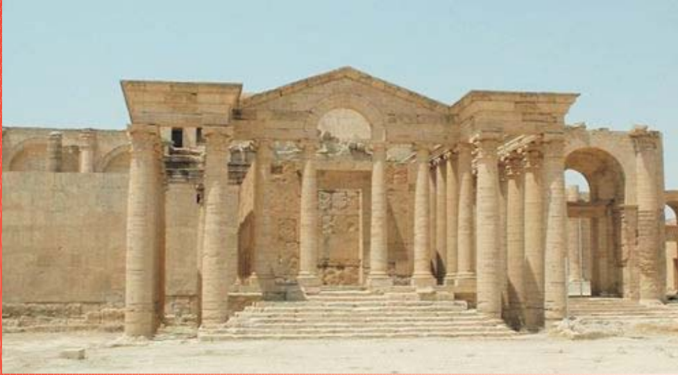
Templo milenario Babilónico.

El año 1.600 antes de nuestra era, tribus Indo Europeas invadieron India y se asentaron en Irán y en Europa. Los hititas, aliados con los Kassites, de orígenes desconocidos, conquistaron y destruyeron Babilonia. El poder hitita disminuyó en la mitad